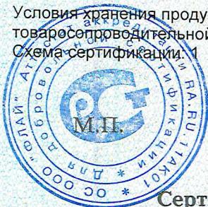
Схема сертификации: 1

Условия хранения продукции, срок хранения (службы, годности) указан в прилагаемой к продукции товаросопроводительной и/или эксплуатационной документации.